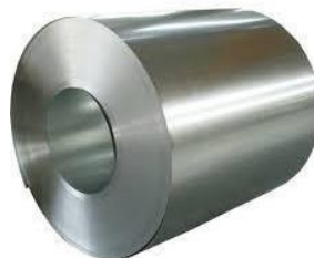
Gambar 3.7. Material JIS G3141 SPCC SD 0,8 mm

Pelat Baja Cold Rolled Coiled disebut sebagai SPCC. Lembaran baja canai dingin kelas komersial adalah yang dimaksud dengan SPCC, menurut standar Jepang JIS G3141. Karena jangkauan aplikasinya yang lebih luas, jenis baja SPCC paling cocok untuk kendaraan, peralatan listrik, dll.