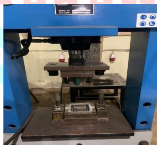
Gambar 3.2. Mesin Press

Mesin press adalah mesin pengerjaan logam yang digunakan terutama untuk memotong, melubangi, atau membentuk logam menggunakan perkakas ( die dan punch ) yang dipasang pada slide dan alas. Perosotan memiliki gerakan bolak - balik yang terkontrol ke arah dan menjauhi permukaan alas dan pada sudut yang tepat terhadapnya.