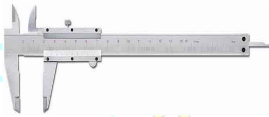
Gambar 3.3. Jangka Sorong

dengan bantuan rahang pengukur. Matematikawan Prancis Pierre Vernier menemukan skala vernier pada tahun 1631. Jangka sorong digunakan untuk mengukur jarak antar benda, mengukur dimensi suatu objek, mengukur dimensi internal dan eksternal secara akurat, dan juga mengukur pengukuran linier yang tepat di berbagai bidang. Tetapi keakuratan dalam penggunaan jangka sorong sebagian besar bergantung pada indera peraba operator.