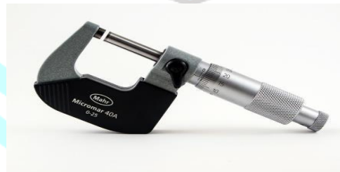
Gambar 3.4. Mikrometer

Mikrometer salah satu dari berbagai instrumen atau perangkat untuk pengukuran jarak atau sudut yang akurat. Mikrometer digunakan untuk pengukuran akurat jarak kecil, ketebalan, diameter, dll. Kesenjangan antara permukaan pengukurnya disesuaikan dengan sekrup halus, rotasi sekrup memberikan ukuran jarak yang sensitif digerakkan oleh permukaan.