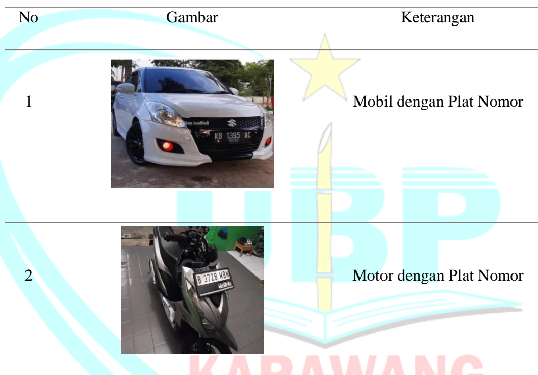
Tabel 3.1 Contoh Gambar Kendaraan

kendaraan yang berada di Indonesia. Dataset yang telah dikumpulkan yaitu sebanyak 1605 gambar, yang mencakup berbagai jenis kendaraan, dan warna untuk memastikan variasi yang cukup dalam pelatihan model. Gambar-gambar tersebut merupakan dataset open source yang didapatkan dari situs roboflow dengan format jpg dan dengan ukuran gambar yang sama yaitu 640x640 piksel.