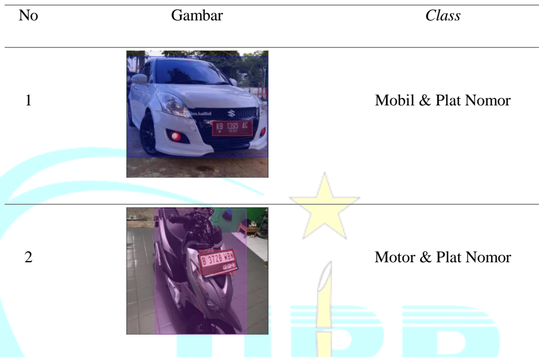
Tabel 3.2 Contoh Pelabelan Class Pada Citra