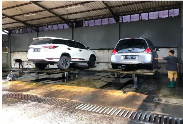
Gambar 1. 1 Lingkungan Kerja Dynasty