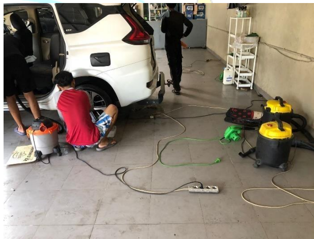
Gambar 1. 2 Lingkungan Kerja Dynasty